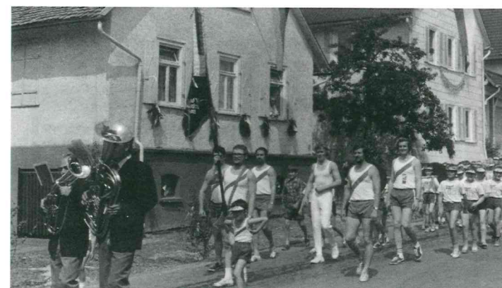
Die Leichtathleten beim Festzug 1972